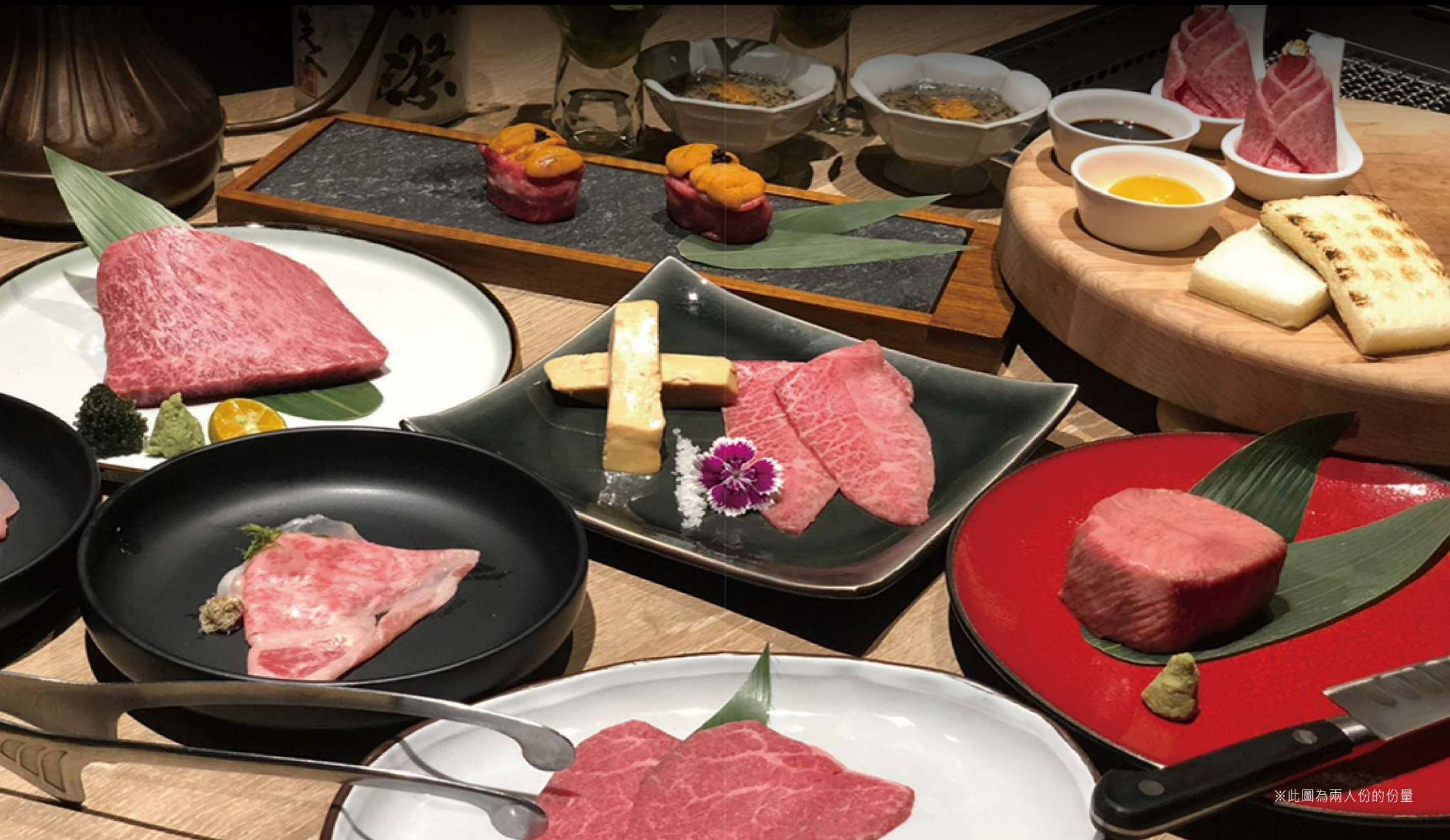
※此圖為兩人份的份量